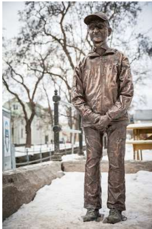
Fotograf: Björn Lans/Balansfoto

https://www.mynewsdesk.com/se/glada-hudik-teatern/images/staty-oever-bosse-oestlin-795467