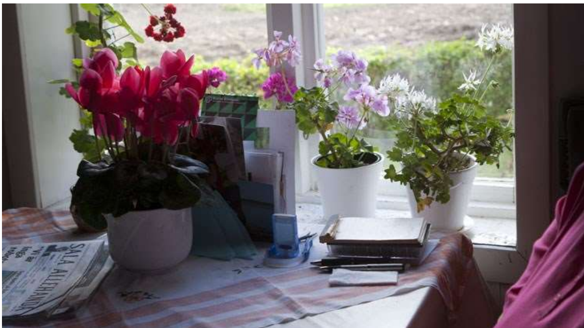
Besök hemma hos en deltagare i projektet om åldrande på landsbygden.

Finns det några speciella förhållanden för den som har en funktionsnedsättning och lever på landsbygden eller på en mindre ort? Det här är en fråga som vi ställer oss i ett forskningsprojekt där landsbygd korsas med funktionshinder. Vi är två kulturgeografer som arbetar med projektet, så frågeställningarna handlar till stor del om människors förhållande till sin omgivning. Hur fungerar bostäder på landsbygden? Hur används naturen? Hur fungerar allmänna kommunikationer? Vilka sociala nätverk upplevs som viktiga och tillgängliga? För att få svar på dessa frågor intervjuar vi boende på landsbygden i tre mindre svenska kommuner med egen erfarenhet av en funktionsnedsättning.